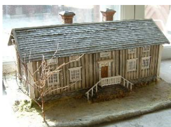
Modell av parstuga Strömsund, Arkitekturmuseet