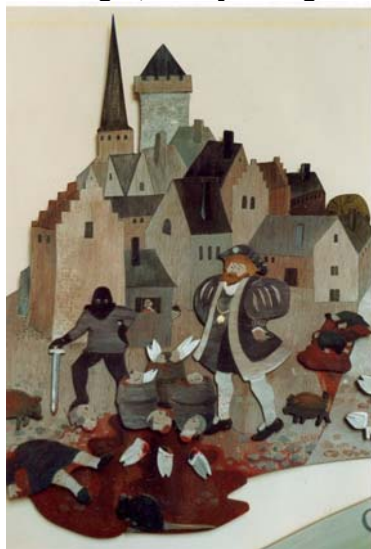
Museum Tre Kronor, Stockholms slott, detalj