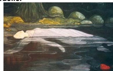
Permanent utsmyckning, Ramsele, detalj