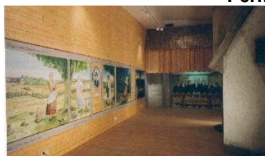
Permanent utställning, Ramsele